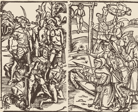
Bambergische Peinliche Halsgerichts-Ordnung, Holzschnitt 1580