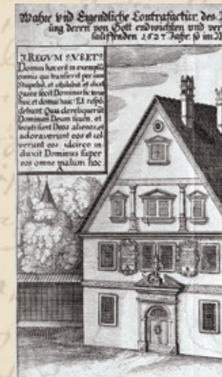
Malefiz-Hauß, Kupferstich 1627 (Ausschnitt)

Treffpunkt: Tourist Information 5,- € p.P. VVK: BAMBERG Tourismus & Kongress Service, Geyserswörthstr. 5