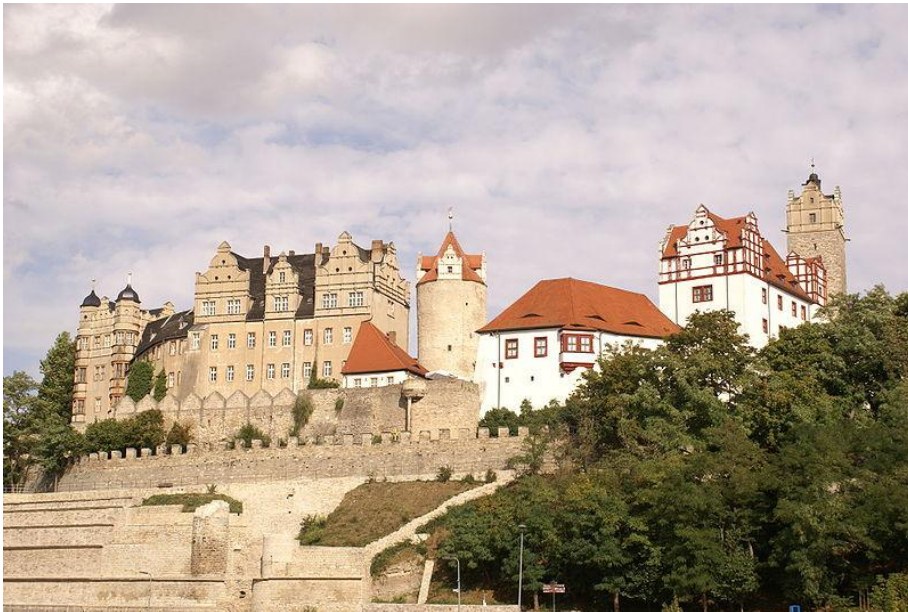
Bernburg Schloss