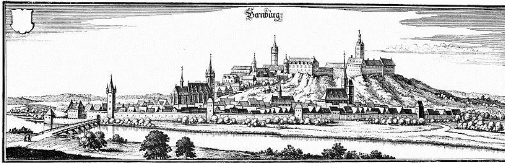
Bernburg um 1650 (Stich von Matthäus Merian aus Wikipedia)