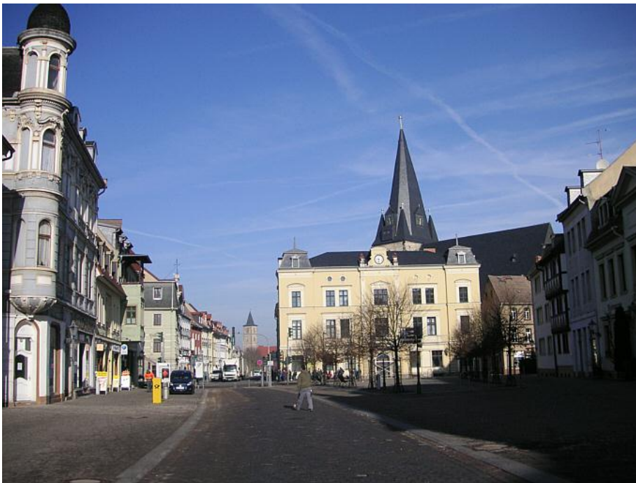
Bernburg Rathaus Talstadt, dahinter die Marienkirche