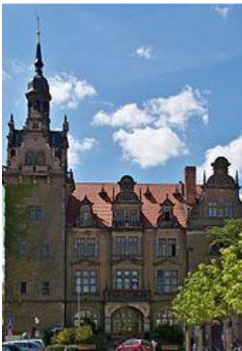
Rathaus Bernburg Bergstadt aus Wikipedia