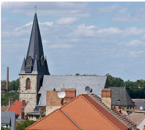
Bernburg Marienkirche

In den Hexenverfolgungen wurden 1555-1664 in Bernburg/ Amt Bernburg/Anhalt mindestens 46 Personen angeklagt.