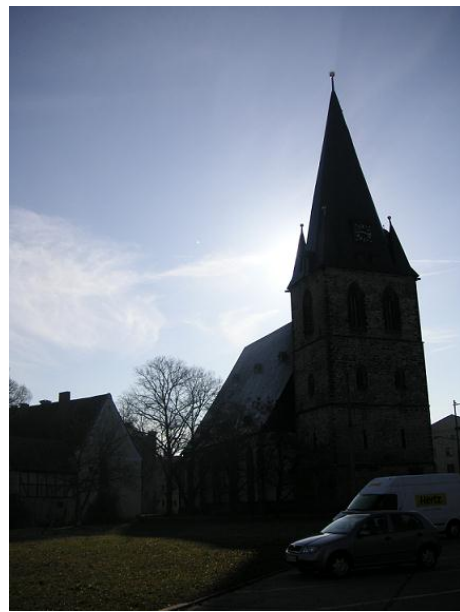
Bernburg Marienkirche und altes Pfarrhaus