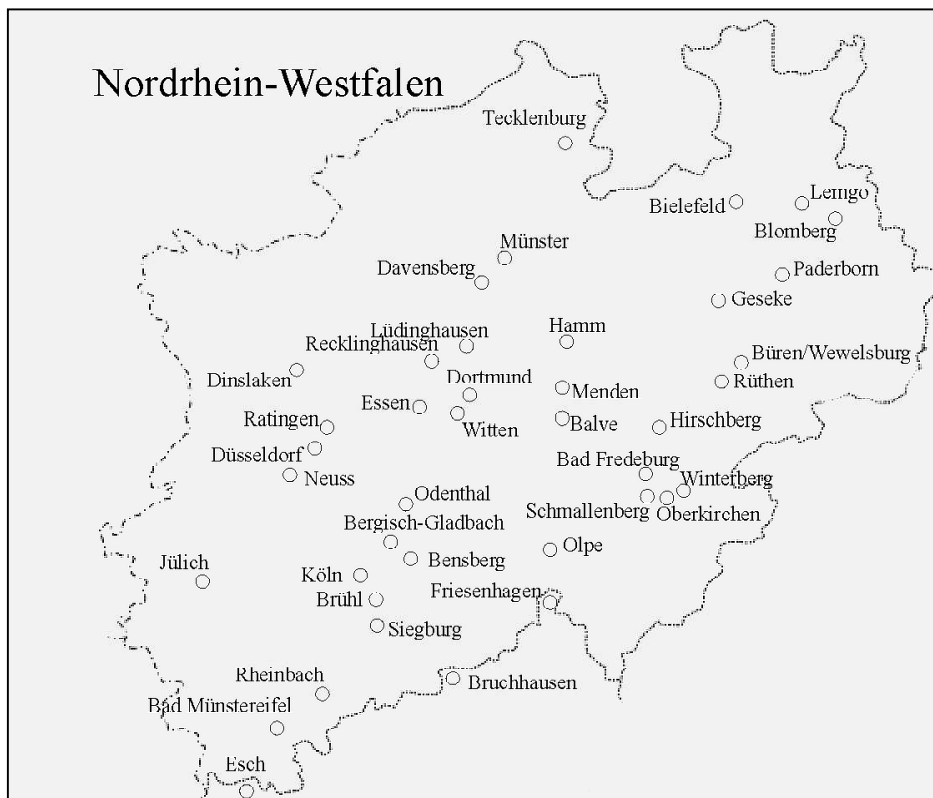
Abb. 3: Karte von Hexengedenkstätten in NRW (Hegeler)